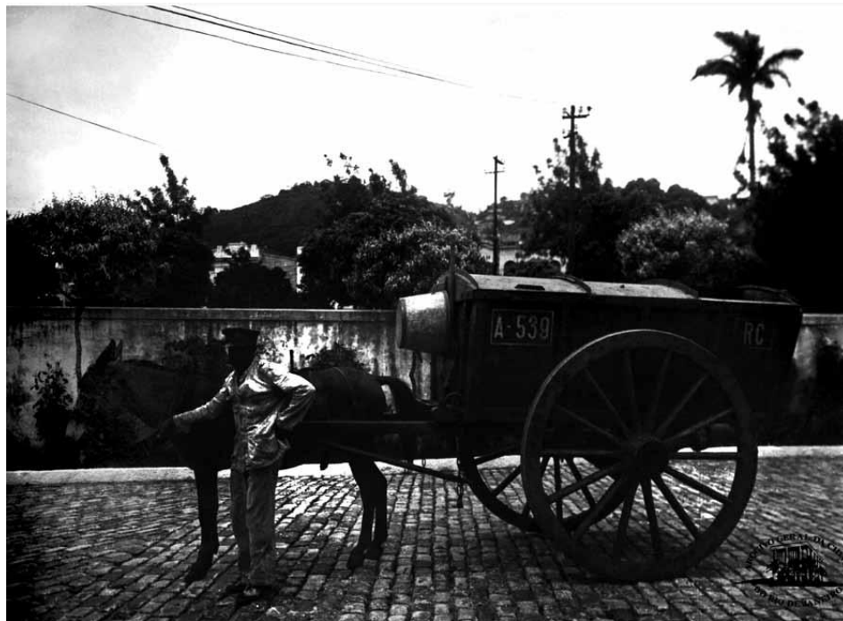
Carroça de lixo a tração animal